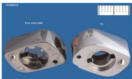
Dekorative Chrombeschichtung aus ionischen Flüssigkeiten

Die ersten Ergebnisse werden auf der europäischen CLEAN MECA Konferenz präsentiert, die von CETIM 2008 ausgerichtet wird. Hier sollen auch die ersten FuE-Programme auf europäischer Ebene ge-