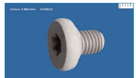
Zn/Sn Beschichtungen von Schrauben